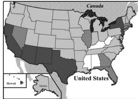
Відсоток людей старших 5 років, які вдома розмовляють іншою, ніж англійська, мовою

У таких штатах як Каліфорнія, Арізона, Нью-Мехіко, Техас, а також у