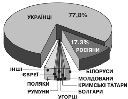
Рис. 6. Етнічний склад населення України (за даними перепису 2001 р.)

Великі і малі етноси заслуговують на державну підтримку їхньої культури відповідно до українського законодавства, якщо вони самі цього прагнуть і мають достатній рівень комунікації між членами спільноти для того, щоб розвивати свою культуру. Кількість етнічних спільнот можна приблизно визначити за числом громад, які мають свої НДО. Їх наявність є свідченням відданості групи своїй культурі та намагання її зберегти (тим більше, що в радянський час більшість цих груп були зрусифіковані й буває важко віднайти інші індикатори їхнього прагнення до практикування своєї самобутності).