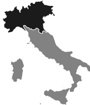
Рис. 5. Поділ території Італії на демократичну Північ і клієнтелістський Південь.

В час, коли Р.Патнам з групою соціологів працювали над матеріалом для майбутньої книги (а це тривало, враховуючи час проведення соціологічного експерименту, понад 20 років) проблема регіоналізму і національної єдності ще не стояла в Італії так гостро, як нині. Вона постала на порядку денному в останні десятиліття, і не в останню чергу