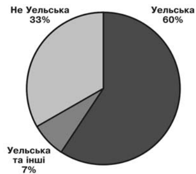
Рис. 1. Самоідентифікація респондентів Уельсу, 2001 11 .

дають політичну націю британців, проживають у чотирьох «конституюючих країнах». Їх чисельність на середину 2005 за офіційною оцінкою становила відповідно 5 млн, майже 3 млн, 1,7 млн і 50,4 млн осіб 10 . Офіційною мовою державних інституцій у Великій Британії де факто є англійська – мова найбільшої етнонації. Проте, в останні десятиліття спостерігається відродження меншинних мов (а це переважно кельтські мови Британських островів – галльська шотландська, уельська, ірландська, корноульська), розгортання рухів за автономізацію «конституюючих країн», зростання етнічної національної самосвідомості.